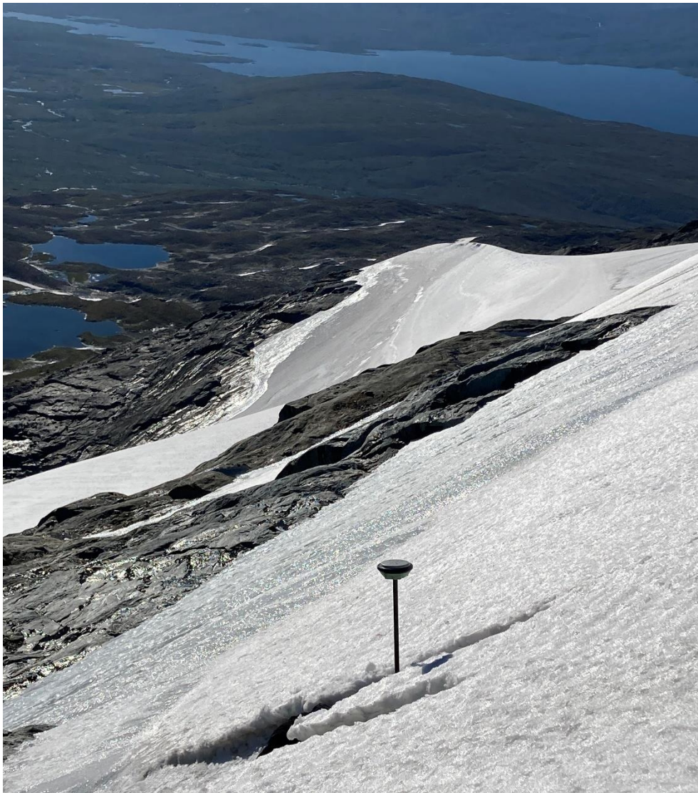
Figur 7: Den högsta punkten på riksgränsen mellan Sverige och Norge (1752 m.ö.h.) besöktes under hösten 2022 på berget Nuortta Sávllo. Riksroset på berget (Rr 236Aa) var dock svårfunnet då det numera är beläget under en glaciär.

Mer att läsa om riksgränsernas definition och återkommande översyner finns att läsa på www.lantmateriet.se/riksgransen .