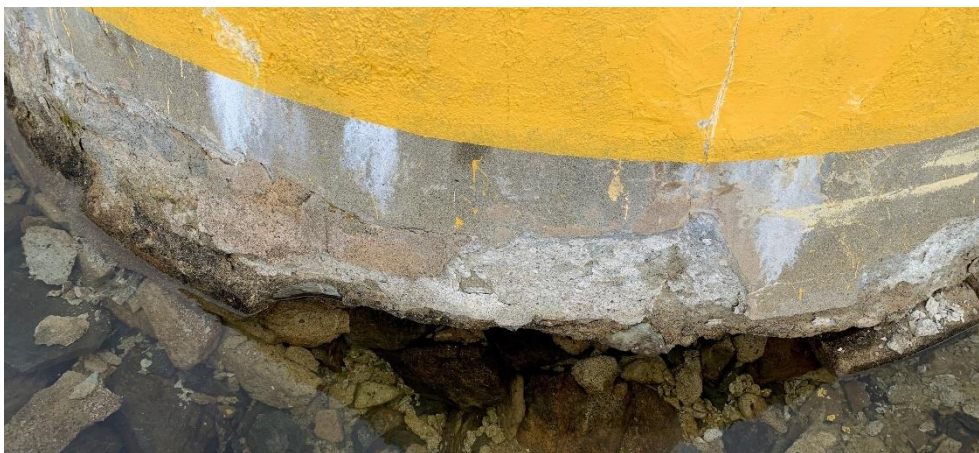
Figur 1: I och med att Treriksröset är beläget i en sjö, så har ganska stora skador genom åren uppkommit på rösets nedre del.

Restaureringen av Treriksröset påbörjades redan under 2018 då Norge genomförde underhåll på den övre delen av röset. I somras åtgärdade den svenska gränskommissionen vid Lantmäteriet de skador som kvarstod på den nedre delen av röset, vilken är påverkad av att röset står i en sjö, se Figur 1.