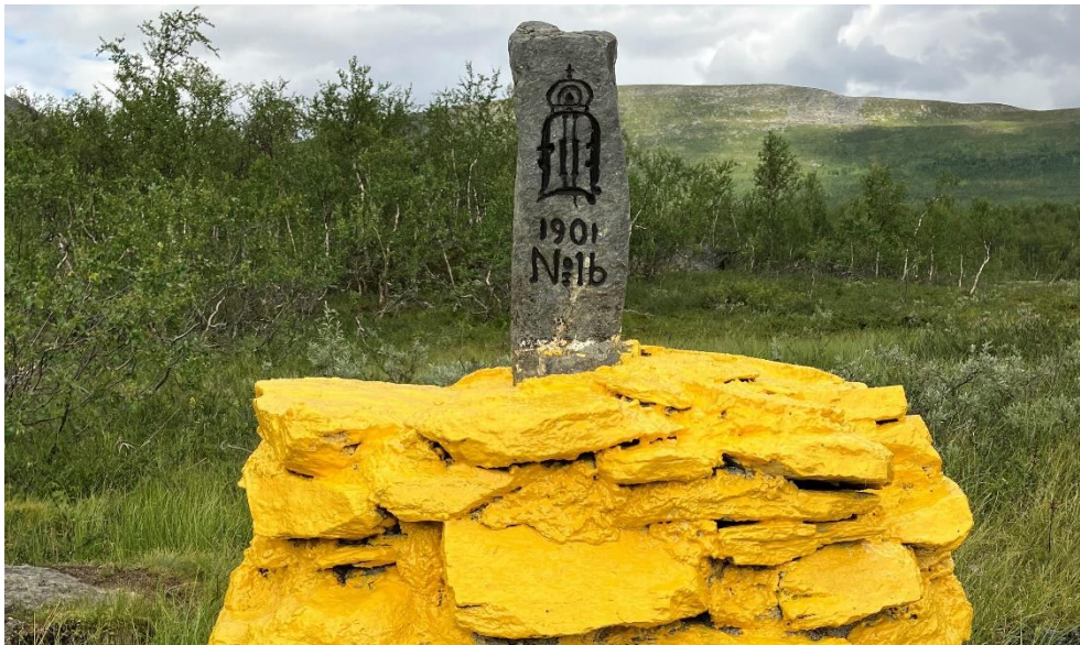
Figur 5: Riksgränsen mellan Sverige och Finland följer huvudsakligen djupfårorna i Könkämäälven, Muonioälven och Torneälven. Längs bäcken Rajajoki vid Treriksrösets omedelbara närhet inleder dock gränsen med att gå via tre riksrösen som också snyggades till i augusti 2022.