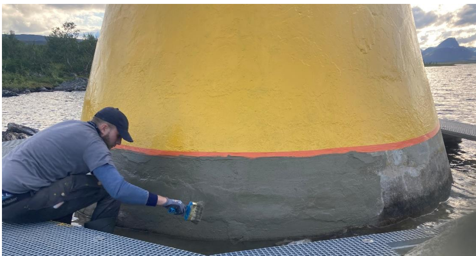
Figur 3: För att få bra hållbarhet vid restaureringen av Tretriksörset användes olika typer av murbruk som applicerades i flera lager. Totalt användes 260 kilo murbruk och 5 liter gul färg för renoveringen.

Restaureringen av örset inleddes med att hamra bort befintlig betong som var dålig. Den nya betongen fick sedan lov att appliceras i flera steg, se Figur 3.