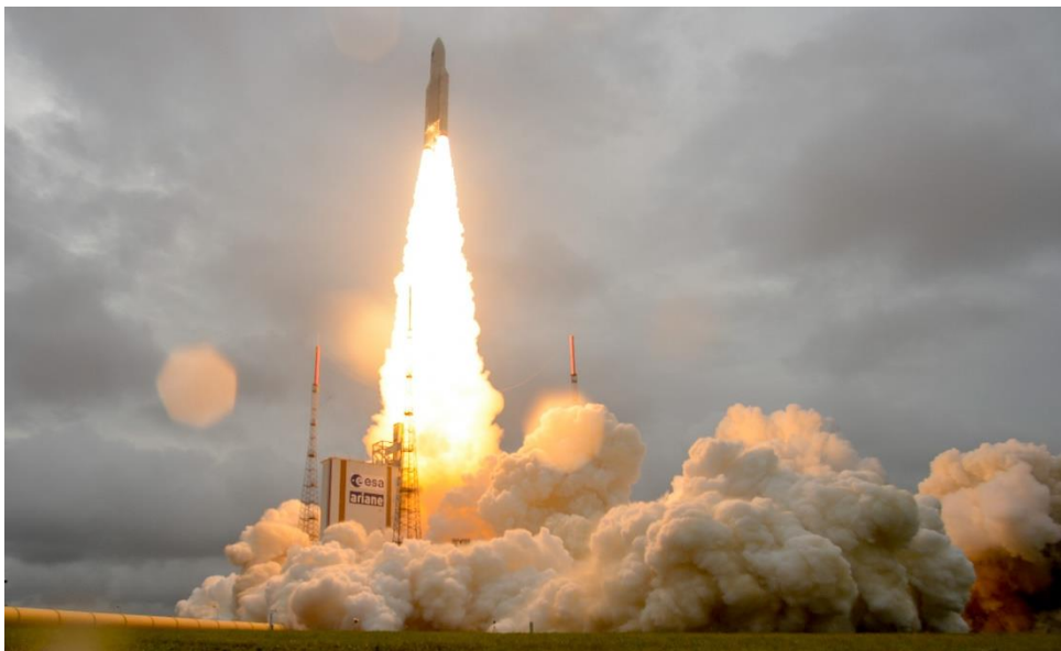
Vid den senaste Galileo-uppskjutningen från Kourou i Franska Guyana sköts fyra satelliter upp samtidigt med en fransk Ariane 5-raket.

Generellt innebär nya satellituppskjutningar för de olika GNSS att moderniserade satelliter med bl.a. högre kvalitet på atomuren kan ersätta äldre satelliter. Galileo har där fördelen att få en helt igenom modern satellitkonstellation. Detta yttrar sig bl.a. i ett högt signal/brus-förhållande för Galileos satellitsignaler (vilket kan begränsa flervägsfelsproblematiken) och i en signalautentisering som kan medge varningar för falska signaler (s.k. spoofing). Även om de olika GNSS-satelliterna sänder ut signaler på motsvarande frekvenser, så finns det en del saker som behandlas lite olika mellan systemen. Dessa saker behöver regleras i RTK-utrustningarna när signaler från flera system används, vilket bl.a. studeras i ett pågående doktorandarbete på KTH i Stockholm (Håkansson et al., 2017 och Håkansson, 2017).