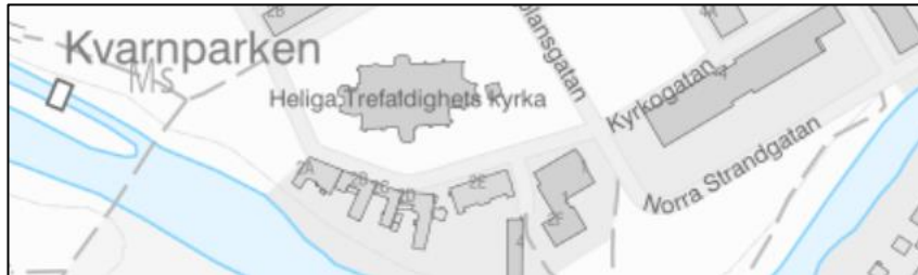
Figur 6. Exempelbild i skala 1:30 236 (SWEREF 99 TM).