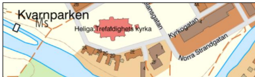
Figur 3. Exempelbild i skala 1:30 236 (SWEREF 99 TM).